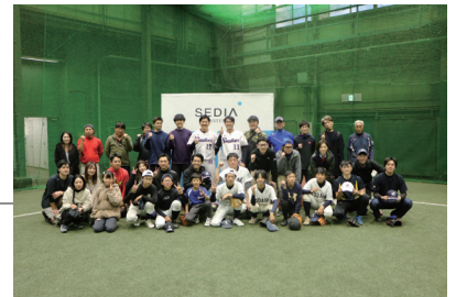
これからも運動の楽しさを伝え続けてまいります

今後も皆さまとふれあう機会をもち、運動の楽しさを伝えるための活動を継続的に行ってまいります。