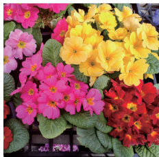
プリムラ サクラソウ科 サクラソウ属