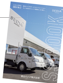
各種最新情報をぜひご覧ください

https://ebook.sedia-system.com/SSBook2024/