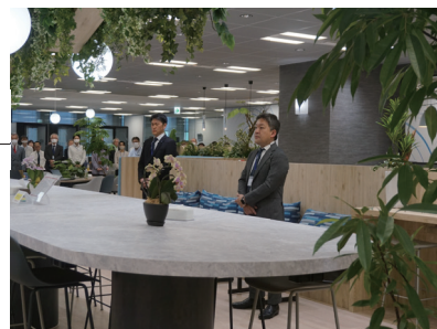
年頭訓示にて災害復旧支援と物流問題について話をしました

これからも生活インフラをつなぎ、社会に貢献することを誇りに「元気で快適な生環境」を積極的に提案してまいります。