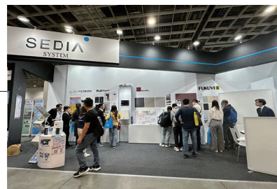
多くの来場者と商談を行いました

台湾では、今後日本と同様に新築集合住宅への「同層排水」が義務化されます。日系管材メーカーの製品にビジネスチャンスが訪れ、ユニットバスの普及期に入ると予測されています。これを受けて、12月に現地で行われた台湾最大級の建築・建材見本市「Taipei Building Show」に台湾渡邊建材も出展し、多くの来場者と商談を行いました。さらなる飛躍に向けて、引き続き活動してまいります。