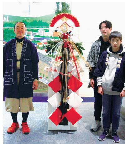
エントランスには立派な御正月飾りが設置されました

これからも生活インフラをつなぎ、社会に貢献することを誇りに「元気で快適な生環境」を積極的に提案してまいります。本年も何卒よろしくお願ひ申し上げます。