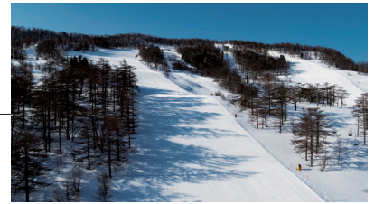
「高峰マウンテンパーク」が今シーズンの営業を開始

● 高峰高原ホテル 〒384-0041 長野県小諸市高峰高原704 TEL/0267-25-3000 WEBサイト/ https://www.takamine-kougen.co.jp/