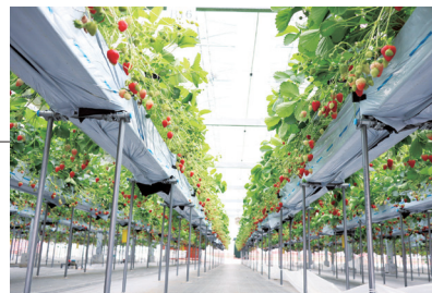
農場見学も随時受け付けています

本件へのお問い合わせは、 [グリーン事業部 営業企画部]まで。 TEL.03-3549-3079