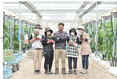
キュウリ農園「株式会社吉ヶ崎農園」をご紹介

本件へのお問い合わせは、 [グリーン事業部 営業企画部]まで。 TEL.03-3549-3079