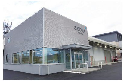
11月に移転した山形サービスセンター

本件へのお問い合わせは、 [総務ユニット 総務グループ]まで。 TEL.03-3549-3071