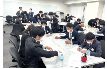
研修での学びをサービスに還元します

社会人2年目に向けて必要な知識や行動、考え方について理解を深めることができる内容となりました。成長し続ける新入社員たちを、どうぞよろしくお願いいたします。