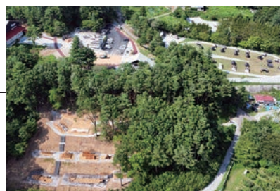
自然を味わい尽くしにぜひお越しください

どのテントからも見えるよう中心で燃え上がるキャンプファイヤーが特徴の「炎のキャンプフィールド」や、子どもが自然の素材と触れ合いながら遊べる「山のアスレチックフィールド」、小道から飛び出すような設計でキャンプ場を一望できる展望台「フィンガーキャノピー」など、親子で楽しめるエリアが充実した施設です。キャンプ初心者やファミリー層でも快適に楽しめるよう、自由度が高く幅広い滞在方法の選択肢をご提供いたします。