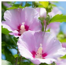
ムクゲ アオイ科 フヨウ属