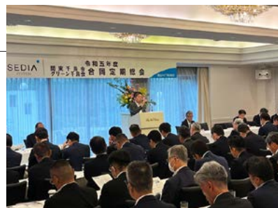
千鳥会総会の実施により親睦を深めました

本件へのお問い合わせは、 [営業推進統括部]まで。 TEL.03-3549-3077