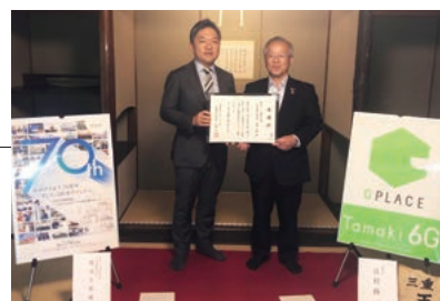
辻村修一町長より感謝状を拝受しました

6月22日、同町佐田の町指定文化財「玄甲舎」で贈呈式があり、辻村修一町長より感謝状を拝受しました。